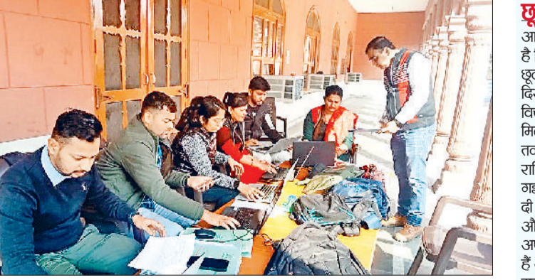
रोहतक। शिविर में लोगों के बिल ठीक करते निगम के कर्मचारी।