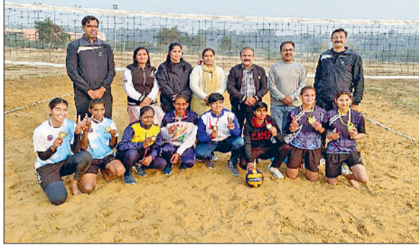
रोहतक। विजेता खिलाड़ियों के साथ कालेज स्टाफ।