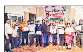
शिविर में 39 लोगों ने किया रक्तदान

रोहतक। सावन कुपाल रूहानी मिशन द्वारा कुपाल आश्रम में मणिपाल अस्पताल द्वारा, दिल्ली के सहयोग से मुफ्त स्वास्थ्य जांच शिविर का आयोजन किया गया। जिसमें हृदय रोग विशेषज्ञ, न्यूरो व स्पॉइन सर्जन, जनरल फिजिशियन, और उससे संबंधित रोग विशेषज्ञ और फिजियोथेरेपिस्ट आदि ने 226 मरीजों की मुफ्त जांच की। इसके अलावा उन्होंने मरीजों को आधुनिक जीवन में स्वास्थ्य के सही रख-रखाव के लिए खान-पान संबंधी महत्वपूर्ण हिदायतें व परहेज आदि भी बताए कि किस प्रकार छोटी-छोटी बातों को ध्यान में रखकर हम अपने स्वास्थ्य की रक्षा कर सकते हैं। शिविर में आए डॉक्टर ने मरीजों को बताया कि आज के आधुनिक युग की तेज रफ्तार और भाग-दौड़ भरी दुनिया में लाभग हर एक व्यक्ति किसी न किसी बीमारी से परेशान है क्योंकि एक-दूसरे से आगे निकलने की दौड़ में वह हठ समय चिंता व तनाव से घिरा रहता है, जिसके कारण उसका ध्यान अपने शरीर के स्वास्थ्य की ओर बिल्कुल नहीं जा पाता।