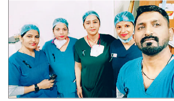
रोहतक। काले बिल्ले लगाकर रोष जताना नर्सिंग स्टाफ।