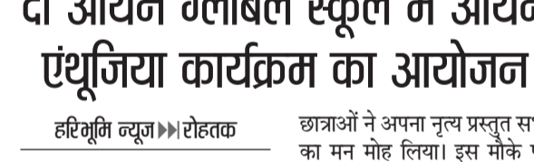
दा आर्यन ग्लोबल स्कूल में आर्यन एंथुजिया कार्यक्रम का आयोजन