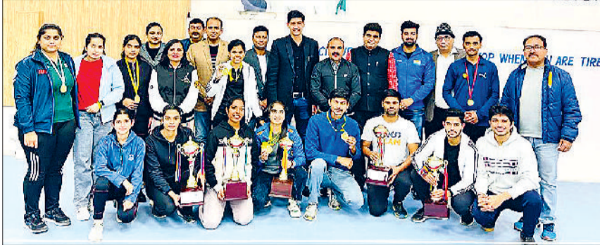
रोहतक। विजेता टीम के साथ कालेज स्टाफ।