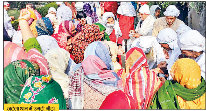
जटैला धाम में उमड़ती भीड़।