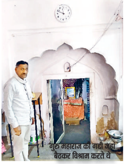
गुरु महाराज को गद्दी चढ़ा बैठकर विश्राम करते थे