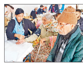
स्वास्थ्य जांच शिविर का किया आयोजन