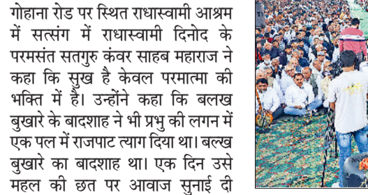
सुख है केवल परमात्मा की भक्ति में : कंवर साहेब महाराज

कोई बिरला सूरमा ही कर सकता है, जिसने अपने आप को मार लिया। उन्होंने कहा कि काम क्रोध मोह माया त्यागे बिना भक्ति हो ही नहीं सकती। गुरु महाराज ने कहा कि एक बार कोई किसी के साथ दगा कर देता है तो वो जीवन भर आपका सगा नहीं हो सकता। क्यों धोखा करते हो, क्यों किसी का बुरा सोचते हो। ऐसे धन की कमाई कोई काम नहीं आएगी।